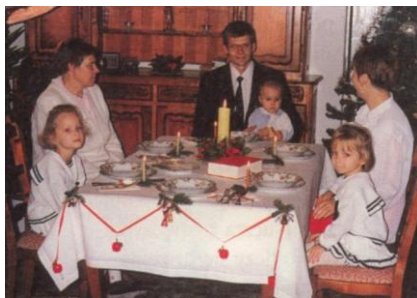
Dawny zwyczaj zostawiania pustego miejsca przy stole wigilijnym jest praktykowany także dziś.

Świeca - Jezus przychodząc na świat rozświetla ciemności grzechu, jest Światłością świata. Zapalana na początku wieczerzy wigilijnej świeca symbolizuje tę Światłość.